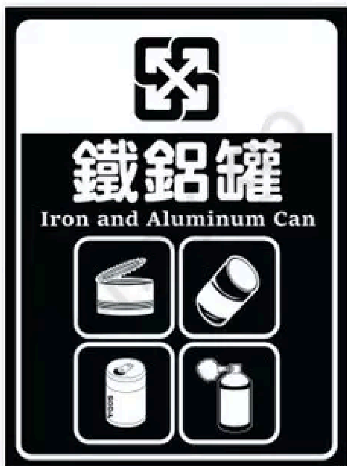
Đồ hộp (nhôm)