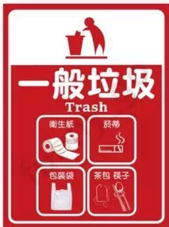
Rác sinh hoạt